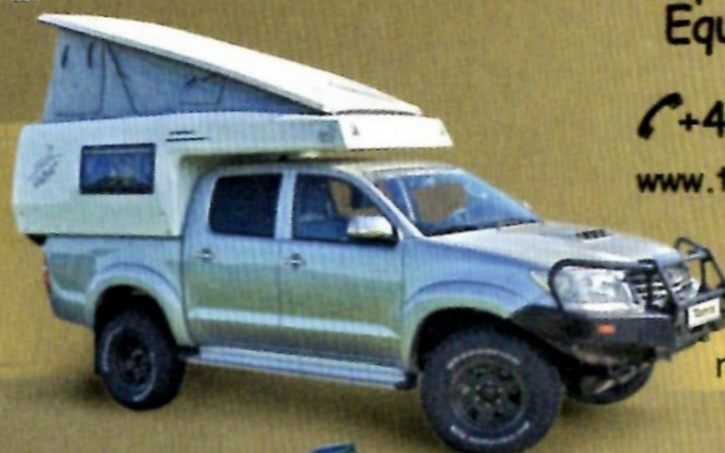
Toyota Hilux mit Gazell-Kabine