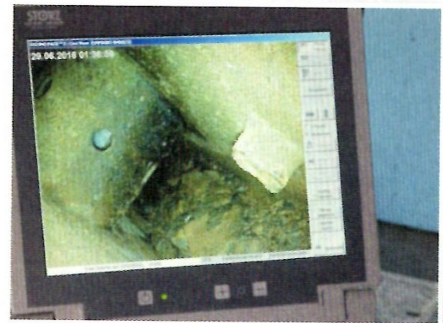
Mit dem Endoskop wird jeder Hohlraum untersucht.