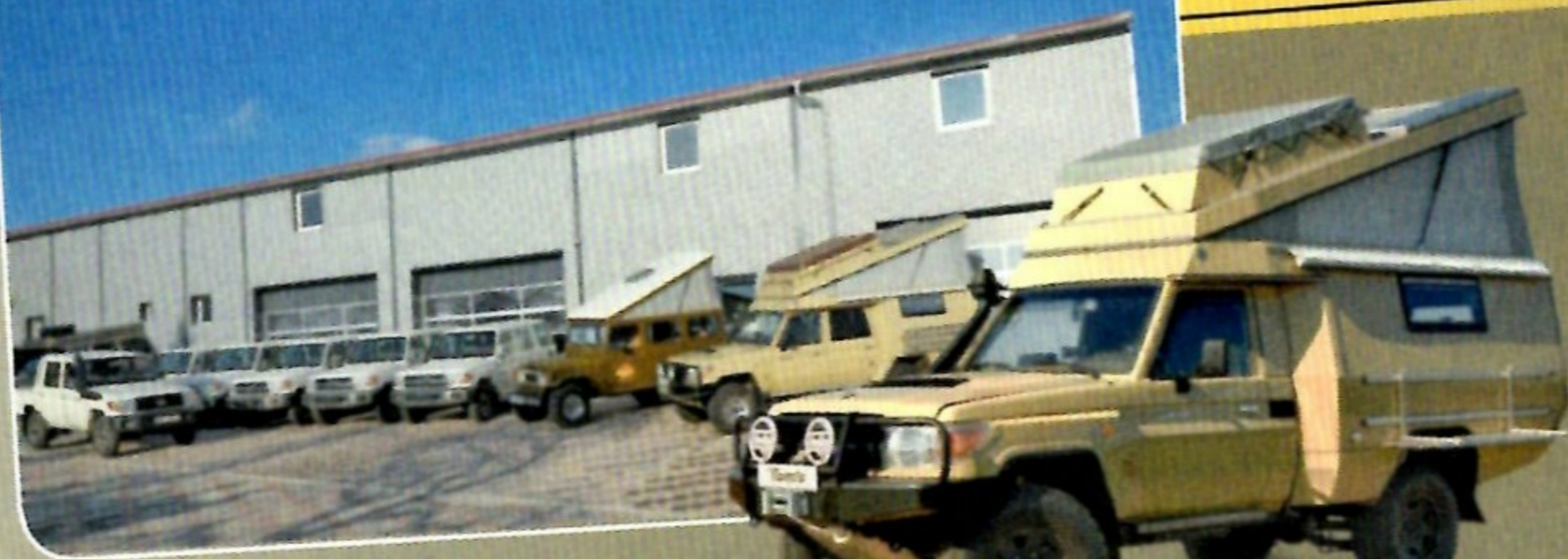
Toyota HZJ 78 mit Heckverlängerung