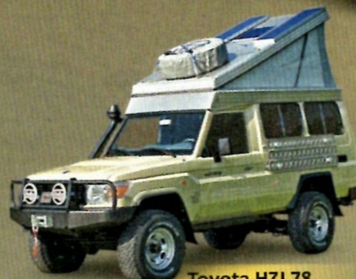
Toyota HZJ 78 mit Klappdach