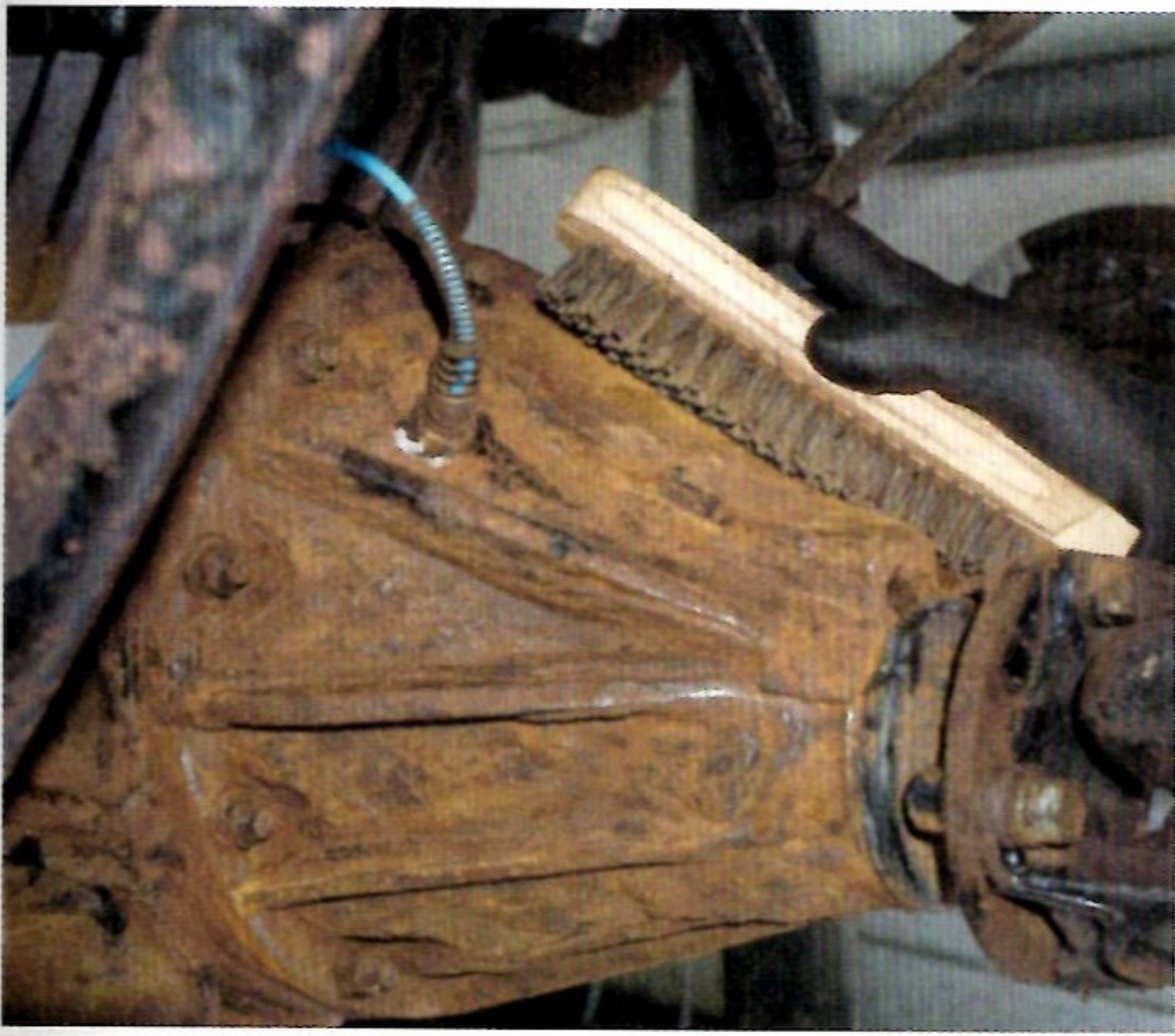
Looser Rost wird mit der Drahtbürste entfernt, um eine tragfähige Oberfläche zu erhalten.