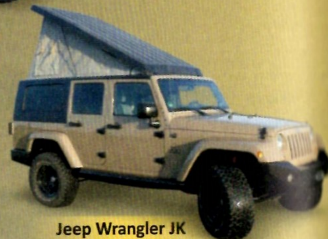
Jeep Wrangler JK mit Gazell-Ausbau-Kit