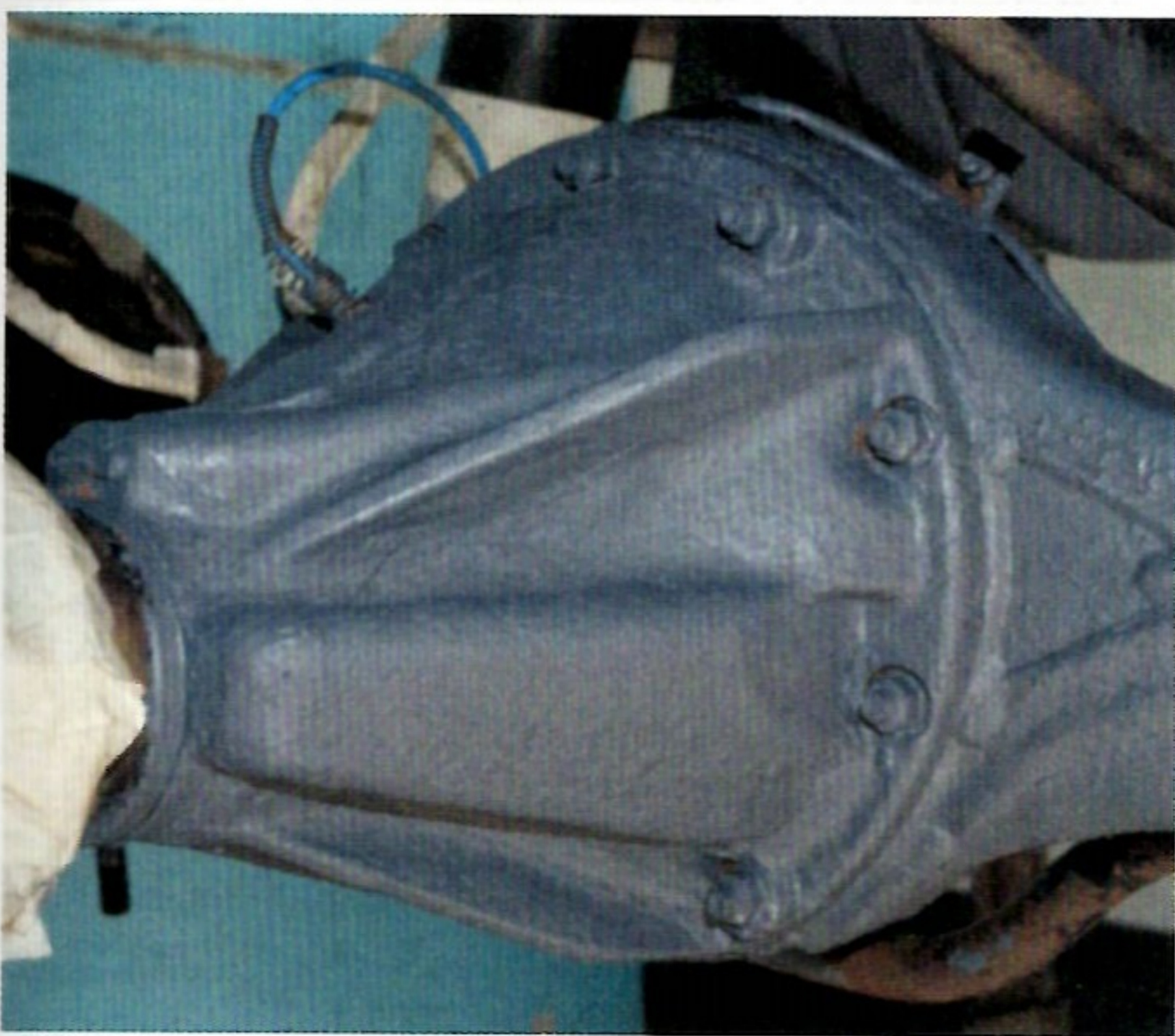
Viele Kleinteile aus Gummi und Kunststoff sind abgeklebt. Die stark angegriffene Ölwanne und das hintere Differenzial erhalten ihren ersten Anstrich mit Paint Repair.

Alle nicht zu behandelnden Flächen des Fahrzeugs müssen abgedeckt werden. Dazu gehören alle lackierten Flächen, Motor und Getriebe, alles aus Gummi und Kunststoff, Schmiernippel sowie Elektrik. Das Abkleben mit Folie, Kreppklebeband und Schaumstoffblöcken dauert mehrere Stunden obwohl ich dem Mechaniker dabei helfe. Diesen Zeitaufwand unterschätzten viele Kunden, erklärt Gerd. Nach der Mittagspause schrubben wir losen Rost mit der Drahtbürste ab und tragen auf Differenzial und Ölwanne mit dem Pinsel Paint Repair auf. Das ist eine besonders kriechfähige Rostschutzfarbe, die tief in das korrodierte Metall eindringt. Sie wird zum Vorbehandeln stark rostgeschädigter Untergründe verwendet. Rammschutz und Anhängerkupplung erhalten derweil ihre dritte Schicht Timemax Color, diesmal wieder in Beige.