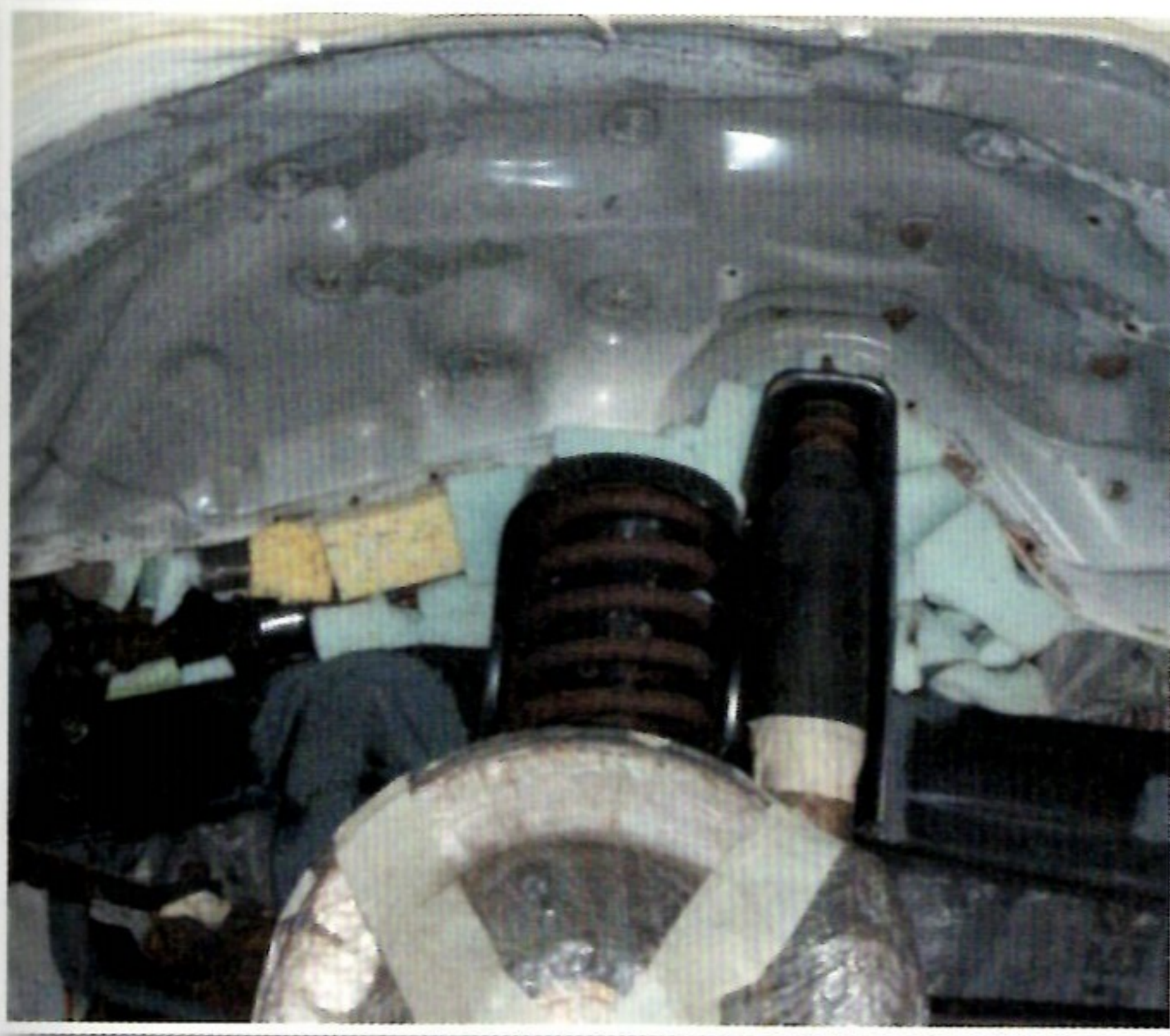
Eigens zugeschnittene Schaumstoffblöcke füllen breite Spalten wie hier zum Motor.