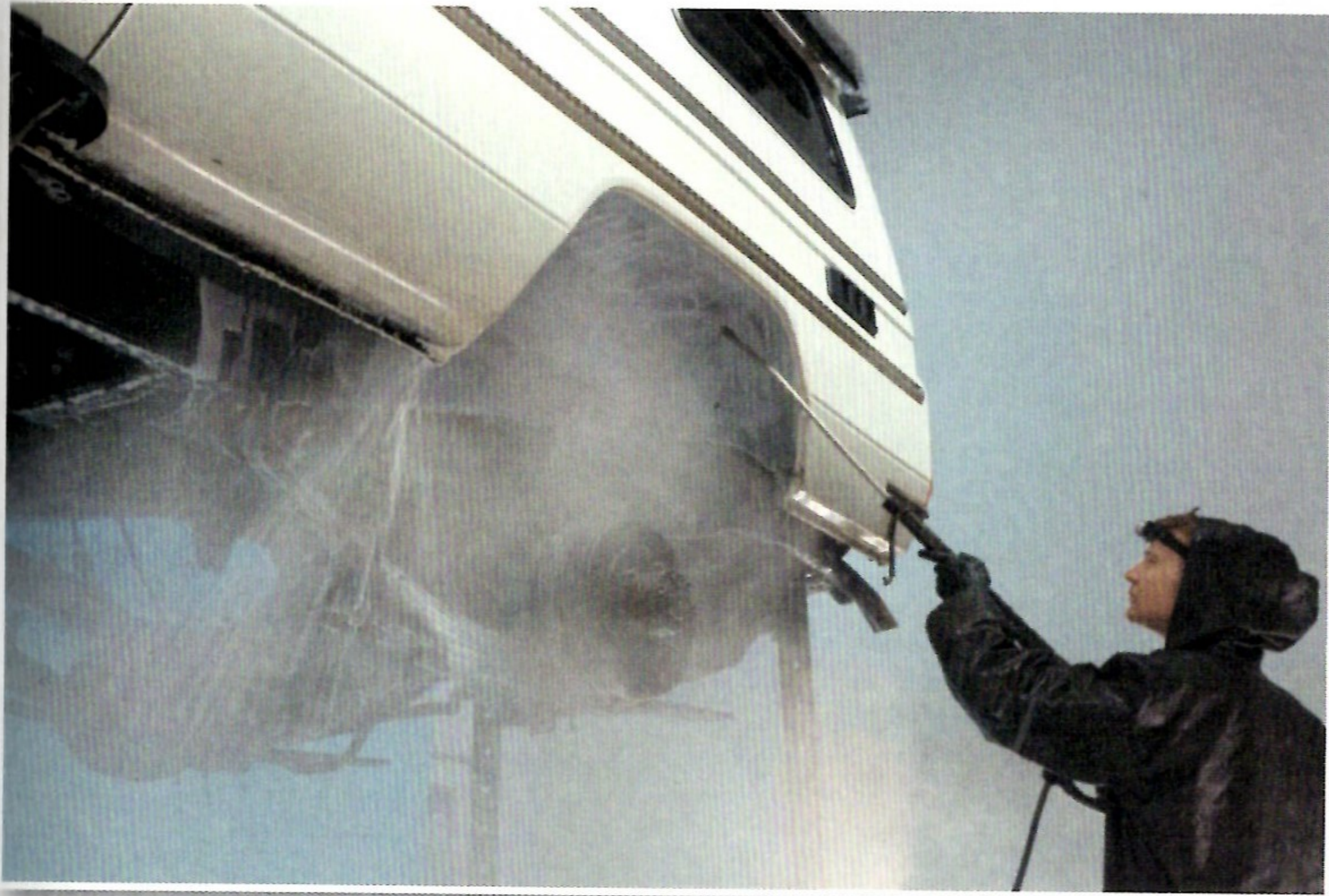
Der Dampfstrahler und ein Reinigungsmittel entfernen Schmutz und Fett.